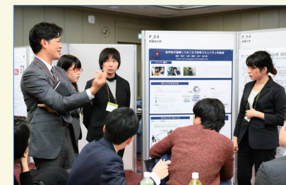
◀ ポスター発表での企業メンターとの意見交換の様子

博士課程教育リーディングプログラムフォーラム2018の【Session A: 社会に新しい価値を実装する】に、本プログラム生5名が参加しました。セッションや懇親会での企業メンター、ファシリテータ、他大学のリーディングプログラム生との交流を通じて、学生たちは大変良い刺激を受けました。