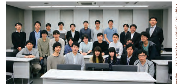
◀新入生(前列)と先輩学生、教員

2018年4月26日(木)、西早稲田キャンパス内において新入生による自己紹介・交流会を開催しました。当日は、先進理工学専攻の教員3名と先輩学生17名も出席し、新入生からの研究紹介や今後の目標などに対して鋭い質問を投げかけていました。